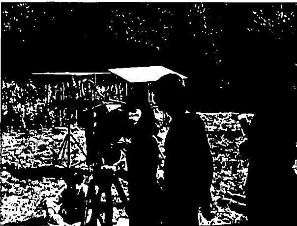
Moi, Pierre Rivière (René Allio).